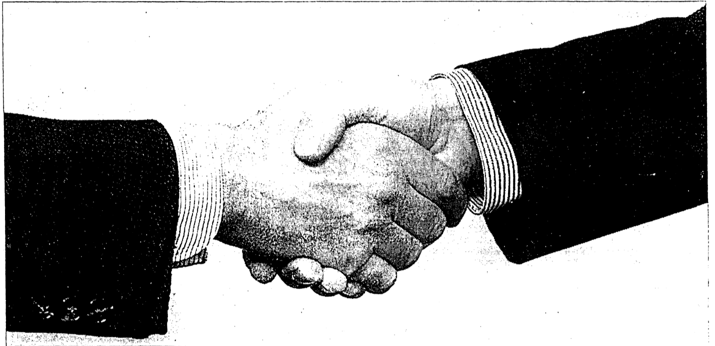
Kein Politiker bestimmt allein über sein Einkommen, die Volksvertreter helfen sich gegenseitig.

Daß die politische Klasse ihre Pension meist zu schnell und zu früh erwirbt, fördert - in Verbindung mit unzureichenden Anrechnungsvorschriften - den Mißstand, daß Politiker Pensionsansprüche aus der Staatskasse häufig sammeln wie Perlen auf der Schnur und wohlversorgt, aber noch sehr aktive ehemalige Minister, politische Beamte oder